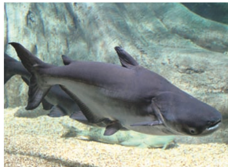
メコンオオナマズ 学名: Pangasianodon gigas 英名: Mekong giant catfish 分類: ナマズ目パンガシウス科 大きさ: 全長300cm 国際自然保護連合(IUCN): 絶滅危惧IA類 ワシントン条約(CITES): 付属書II類

現在では漁期や漁師は厳しく制限され、捕れた魚は大変な高級魚として扱われています。タイの水産局では1983年に初めて人工繁殖により一代目(F1)を得ることに成功し、2001年には二代目(F2)を得ることに成功しました。今では安定して増やすことが出来るようになり、養殖された個体はメコン川などへの放流、研究や食用に利用されています。